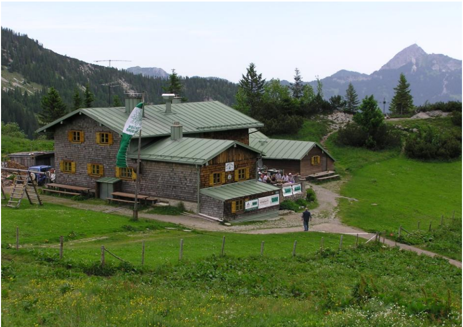
Taubensteinhaus von Südwesten mit Wendelstein