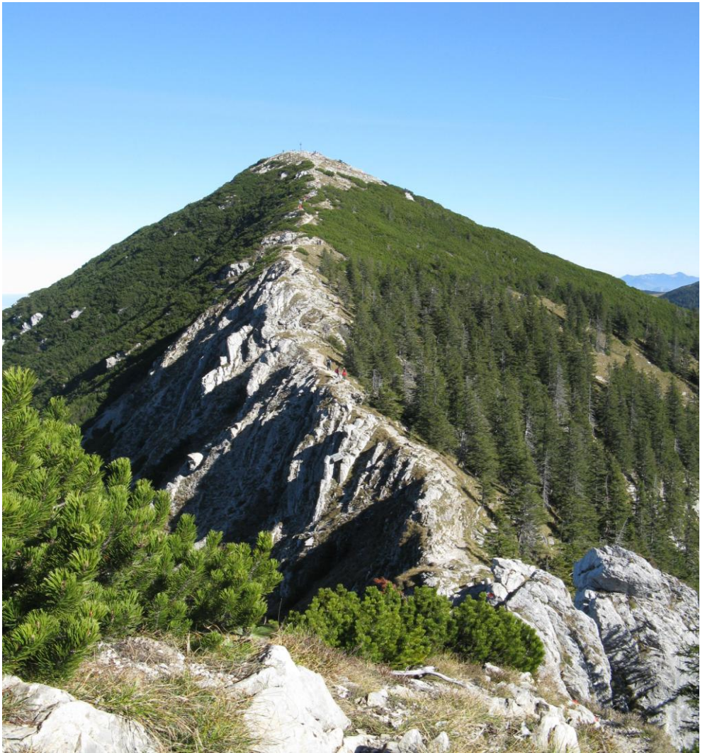
Foto Titelseite: Spitzingsee vom Brecherspitz-Südwestgrat (14.10.2007 um 14 Uhr) Foto oben: Brecherspitz-Südwestgrat (zur selben Zeit vom selben Standort) Foto Rückseite: Taubensteinhaus und Hochmiesing vom Taubensteinsattel