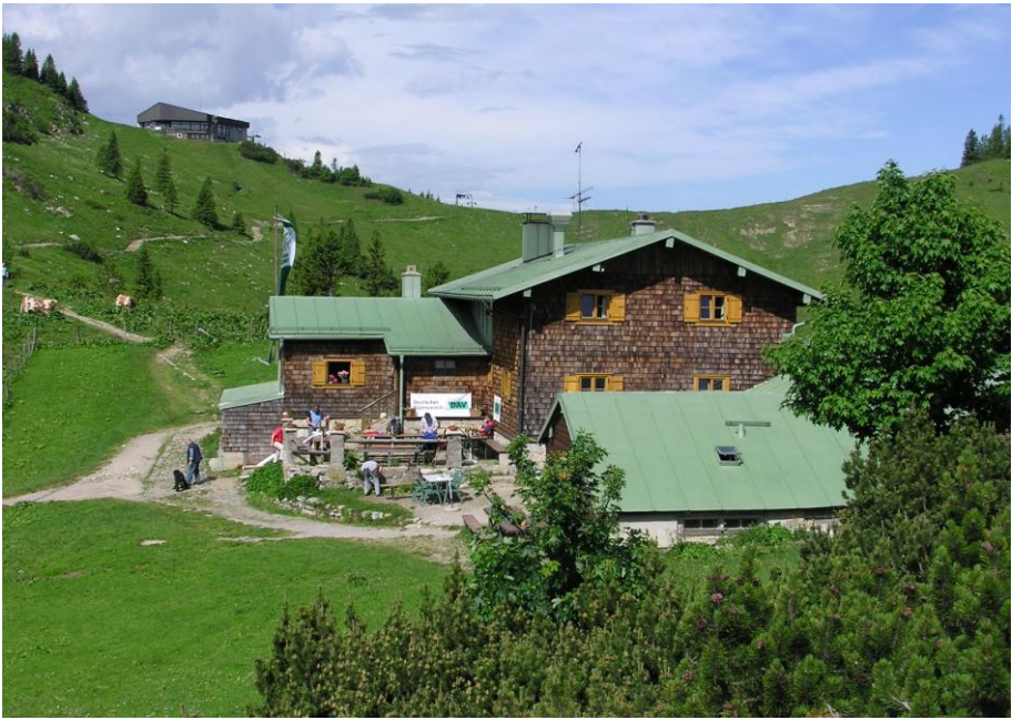
Taubensteinhaus von Osten mit Taubensteinsattel